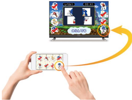
画像：『テレビーナ』を用いてアプリを表示した画面イメージ

株式会社セガは、テレビとスマートフォンを連携させて楽しむ、新発想の知育エンターテインメント・サービス『テレビーナ』を開発しました。同サービスはシャープ株式会社より今秋発売予定の「AQUOS クアトロソ プロ」XL20 ライン ※1 への搭載を皮切りに、順次展開してまいります。